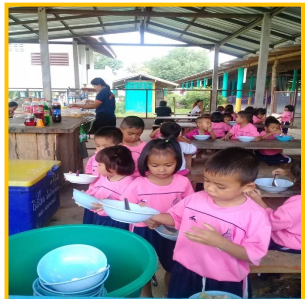
ผลการจัดกิจกรรมสนองความต้องการและความสนใจของเด็กผู้การเรียนรู้ที่จะเป็น (Learning to be)