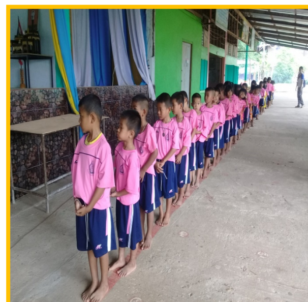
ผลการจัดกิจกรรมส่งเสริมพัฒนาการของเด็กปฐมวัยทั้ง 4 ด้านสู่การเรียนรู้ที่จะรู้ (Learning to know)